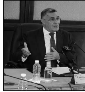
وقوع الأعطاب. كما أمر الوزير بترشيد جهود إطارات وعمال

وأمر بإعداد خطة عمل استرجالية تحضيراً لعيد الأضحى وموسم الاصطياف. وضمان تزويد المواطنين بالمياه الصالحة للشرب بصفة منتظمة ومستقرة. بالإضافة كذلك إلى القيام بتشخيص دقيق لوضعية القطاع لمعالجة الاختلالات المسجلة في بعض المناطق. ناهيك عن تعزيز التواصل مع المواطنين وضمان حقهم في الإعلام، خاصة في حالات انقطاع التزود بالمياه أو