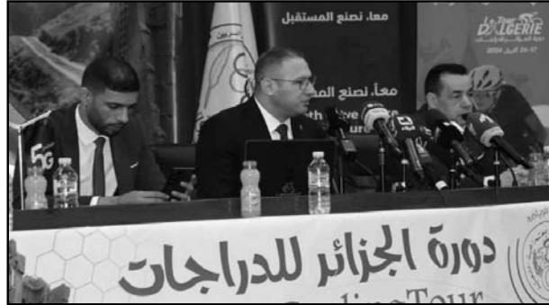
معد لصنع المستقبل معد لصنع المستقبل معد لصنع المستقبل

للسياحة الجزائرية، والتعريف بالمؤهلات الطبيعية والثقافية التي تزخر بها مختلف مناطق الوطن.